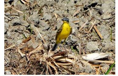
c. PLISZKA ŻÓŁTA