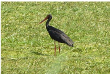
g. BOCIAN CZARNY