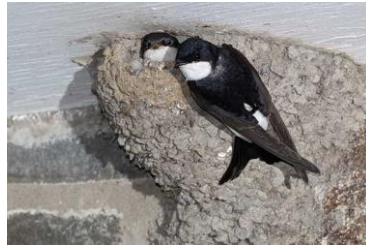
e. (JASKÓŁKA)OKNÓWKA f. (BOJOWNIK) BATALION