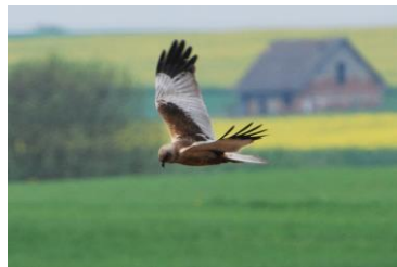
h. BŁOTNIAK STAWOWY