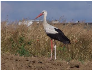
j. BOCIAN BIAŁY