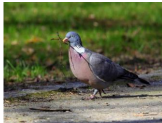
k. (GOŁĄB) GRZYWACZ