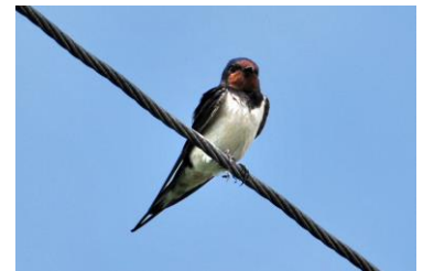
i. (JASKÓŁKA) DYMÓWKA