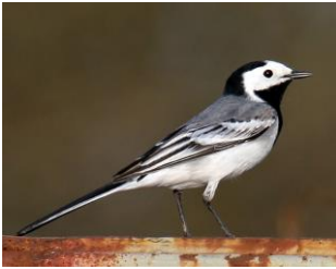
d. PLISZKA SIWA