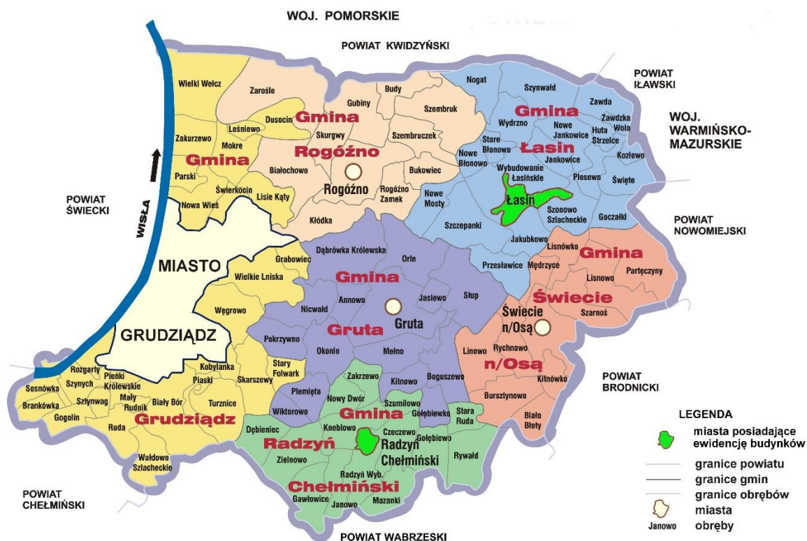
Rys. nr 1 Podział administracyjny Powiatu Grudziądzkiego

Powiat Grudziądzki położony jest w północno - wschodniej części województwa kujawsko - pomorskiego. Sięga swoim terytorium brzegu Wisły. Od północy powiat sąsiaduje z powiatem kwidzyńskim (woj. pomorskie), od wschodu z powiatem iławskim i nowomiejskim (woj. warmińsko – mazurskie), a od południowego wschodu oraz od południa z powiatem brodnickim, wąbrzeskim i chełmińskim. Jego powierzchnia obejmuje cztery gminy wiejskie: Rogóźno, Świecie nad Osą, Gruta i Grudziądz oraz dwie gminy miejsko – wiejskie: Łasin, Radzyń Chełmiński.