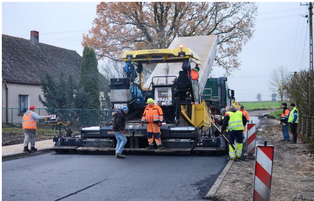
Prace remontowe na drodze powiatowej Dąbrówka Królewska – Gruta